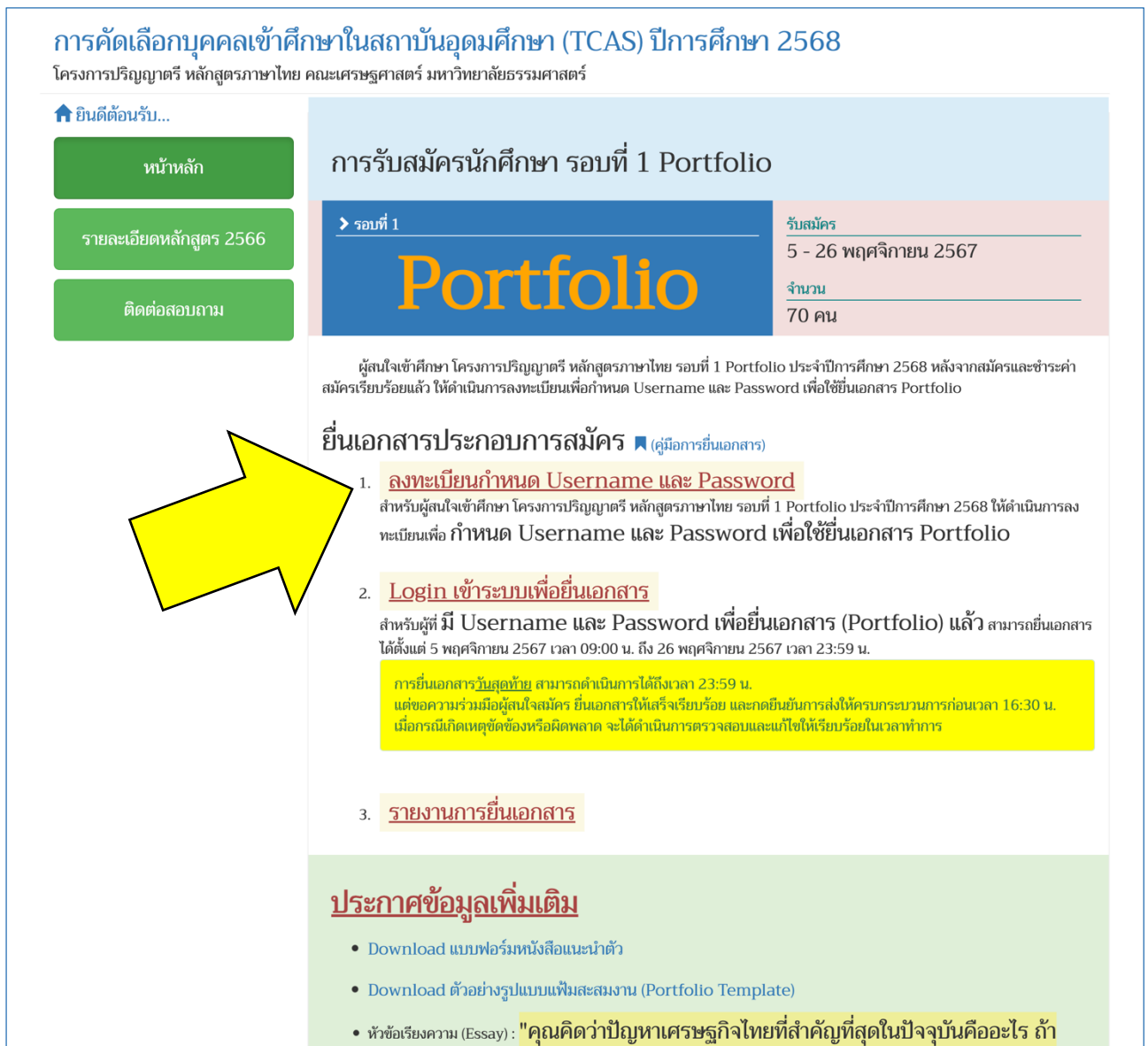
ภาพที่ 1 แสดงหน้าจอเพื่อลงทะเบียนกำหนด Username และ Password