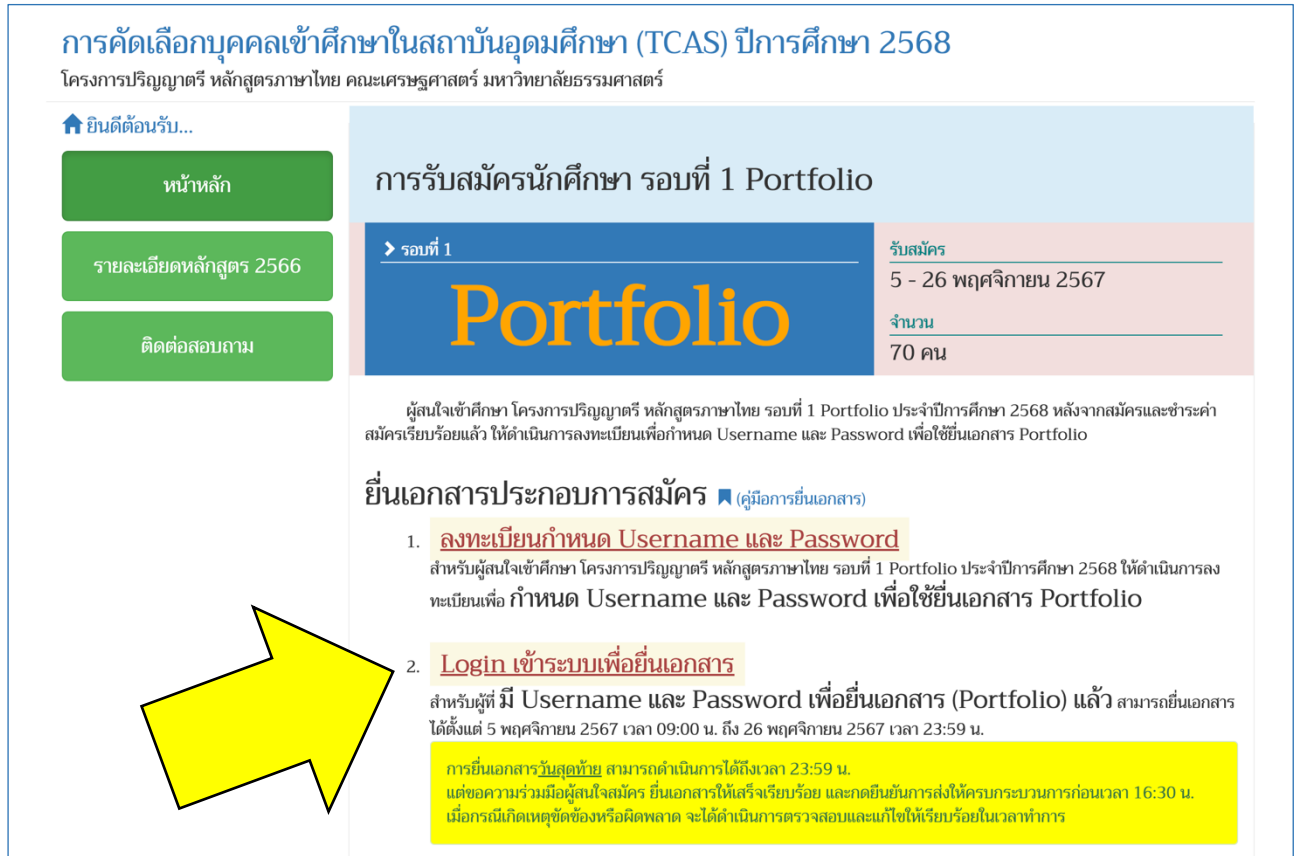
ภาพที่ 5 แสดงลิงก์สำหรับ Login เข้าระบบยื่นเอกสาร